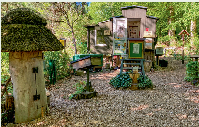
Gelände Bienenwagen Zoo Rostock.

die zahlreichen ehrenamtlichen Helfer des gastgebenden Landesverbandes und Mitarbeiter des LIB in Hohen Neuendorf. Bei optimalen Bedingungen fand in der wunderschönen Location auf dem Gelände des Rostocker Zoos der Teamwettbewerb bei strahlendem Sonnenschein statt. An neun praktischen Stationen sowie in einem Theorietest konnten die Teams, bestehend aus jeweils drei Jugendlichen im Alter von 13 bis 17 Jahren, ihr Wissen unter Beweis stellen.