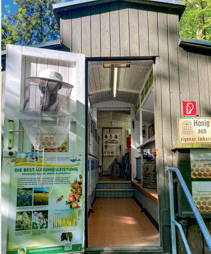
Bienenwagen Zoo Rostock.