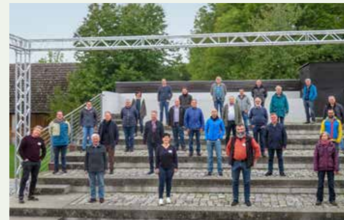
Teilnehmer der AFI-Tagung 2020 mit Corona-bedingtem Abstand.

Die Tagung der Arbeitsgemeinschaft der deutschsprachigen Fachberater fand in diesem Jahr unter erschwerten Bedingungen statt. Die ursprüngliche Planung musste geändert und der Coronasituation angepasst werden. Sie fand daher unter Mitwirkung des Imkereiteams der Triesdorfer Tierhaltungsschule im Altmühlsee-Informationszentrum in Muhr am See, Mittelfranken, statt. Dort konnten die Vorgaben des Infektionsschutzgesetzes entsprechend umgesetzt werden. Das mittelfränkische Seenland mit seiner strukturreichen Region ist für